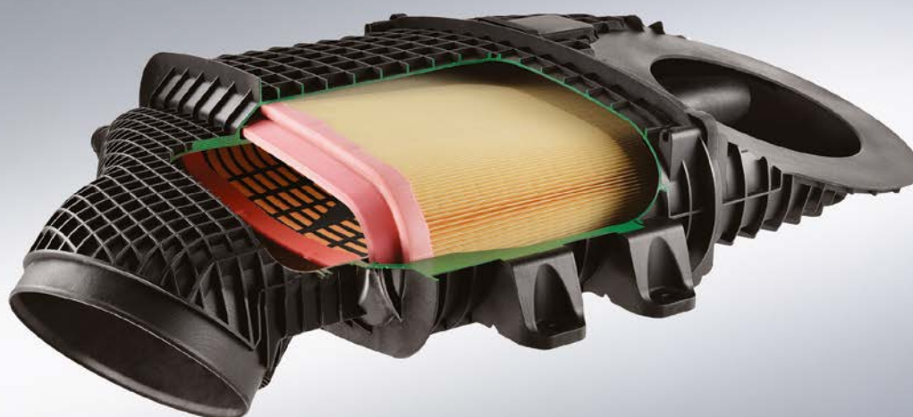
Технология EXALIFE – воздушный фильтр для монтажа в тесных и узких местах

Создав технологию VarioPleat, специалисты MANN+HUMMEL совершили прорыв в области систем фильтрации. С помощью этой уникальной по мировым меркам технологии можно создавать воздушные фильтры с высотой складки до 300 мм. Причем она позволяет формировать у